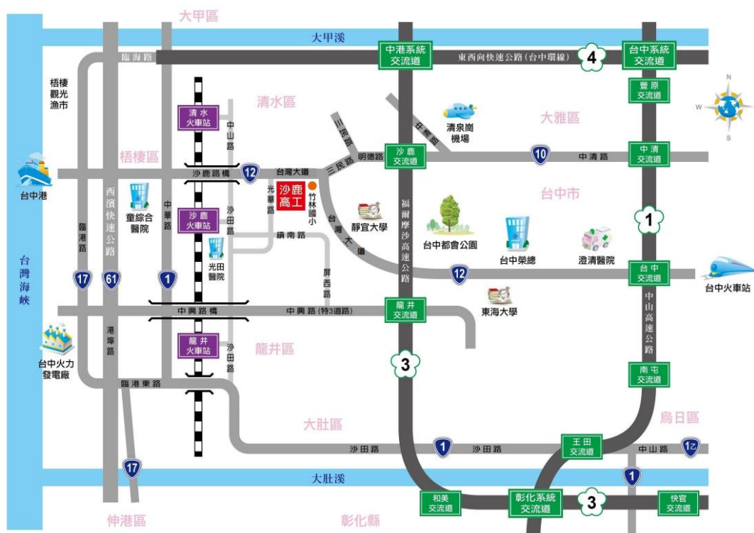
附圖一承辦學校（臺中市立沙鹿工業高級中等學校）位置圖